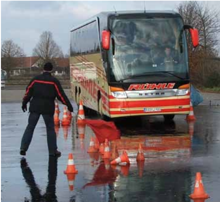
Mit geschultem Personal sicher ans Ziel.